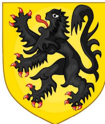
Gecompileerd door Jean Paul De Cloet Gent – Geschiedkundige Heruitgeverij - 2014

De Vlaamse eisen en het Activisme gedurende de eerste wereldoorlog