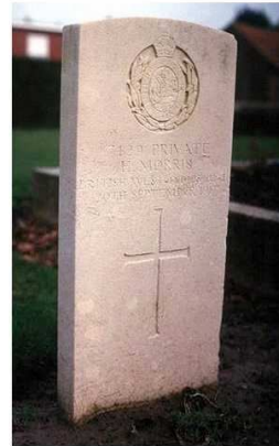
Gecompileerd door Jean Paul De Cloet Gent – Geschiedkundige Heruitgeverij - 2014