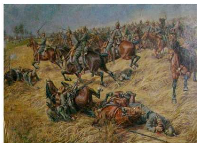
Gecompileerd door Jean Paul De Cloet Gent – Geschiedkundige Heruitgeverij - 2013