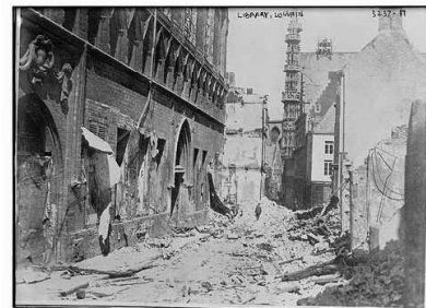
Gecompileerd door Jean Paul De Cloet Gent – Geschiedkundige Heruitgeverij - 2013