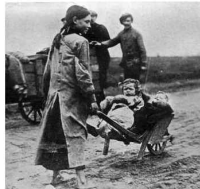
Gecompileerd door Jean Paul De Cloet Gent – Geschiedkundige Heruitgeverij - 2013

De vluchtelingen voor de eerste wereldoorlog